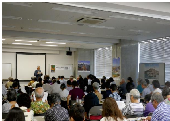
ワイン・チーズ・生ハムの試飲試食風景