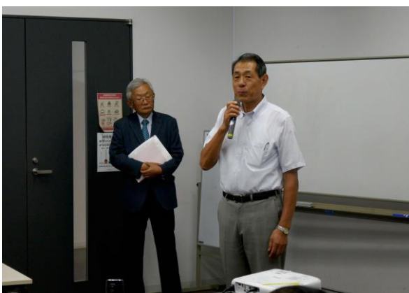
飛び入りで、逗子市桐ヶ谷市長ご挨拶