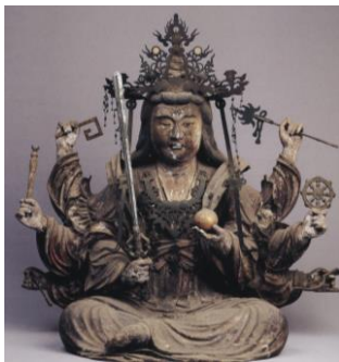
木 江ノ島神社 弁才天坐像