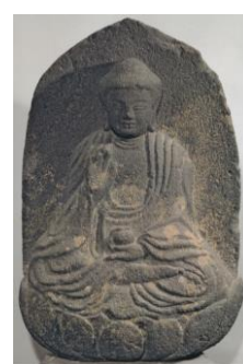
石 九品寺 薬師如来坐像