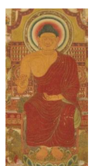
糸 奈良博物館 釈迦如來說法