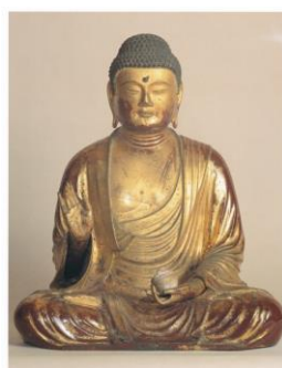
金銅 寿福寺 薬師如来坐像