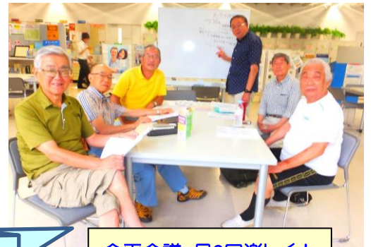
企画会議、月2回楽しく!