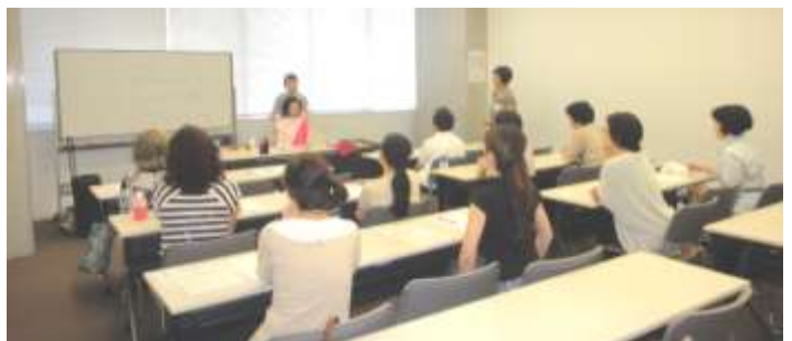
パーソナルカラー・レッスン