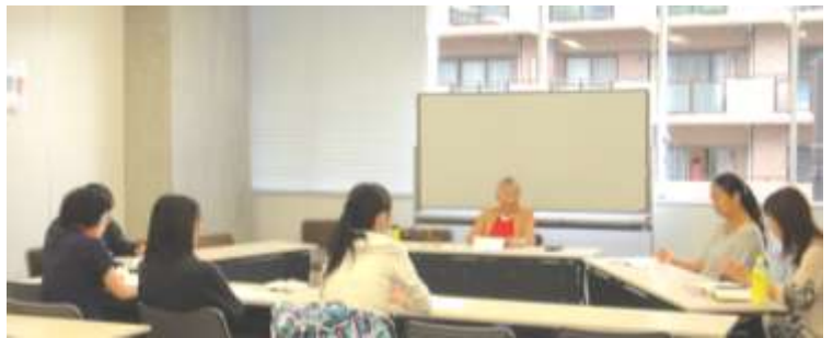
フランス語 初級講座

受講者の感想は、「先生のセンスの良さと、素敵な人柄に触れることができ、満足のいく講座でした」「手ごろな料金で、本格的な講座と講師の方でよかった」「とても分かりやすく楽しく学べて勉強になった」「とても熱心にご指導いただき勉強になった。フランス旅行に行ける日のために頑張ります」「毎回とても楽しく時間を忘れてしまいました。毎回作品が出来上がるのも嬉しく、受講して良かった」など好評で次年度以降の開催を望む声が多くありました。