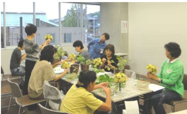
3 種類のウェディングブーケ レッスン